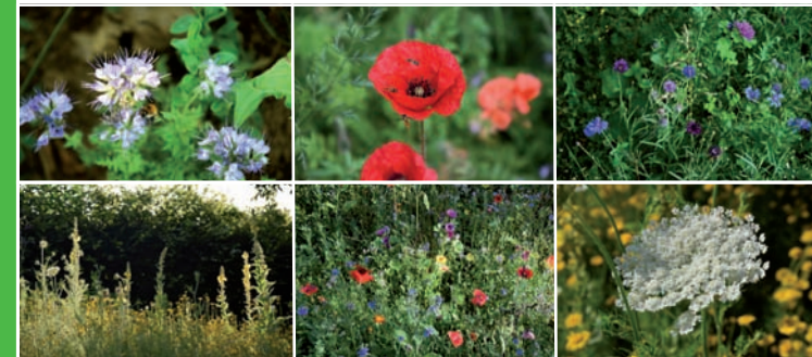
Bilder von unserem Bienenweiden-Projekt 2019/2020